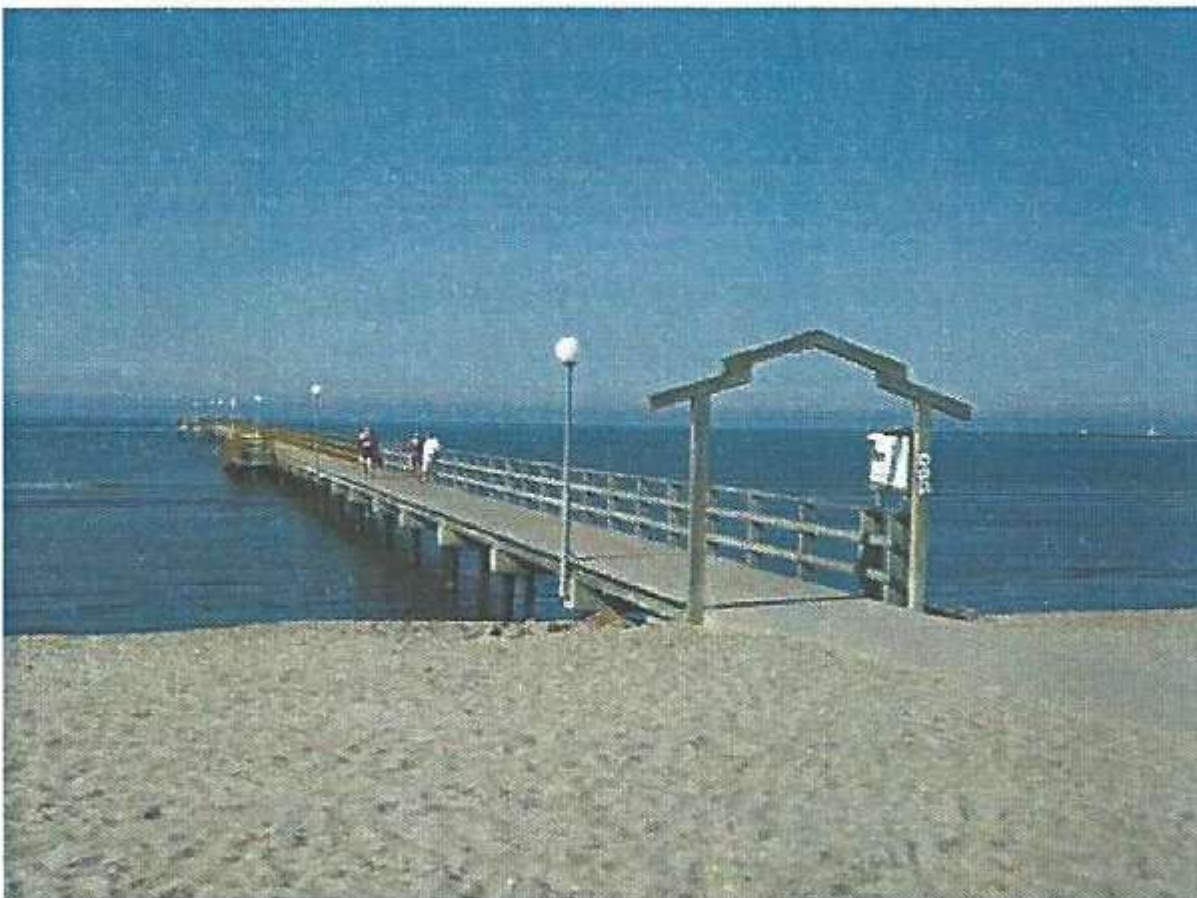
Brygga Skrea strand Falkenberg

Skummeslövsstrand är en attraktiv badplats för ortsbefolkning, fritidshusägare och turister. Med en brygga för alla kommer tillgängligheten till havet att förbättras och bidra till ett ökat intresse för Skummeslövsstrand. Bryggan kommer att utgöra en samlingspunkt, ett promenadstråk och ett utflyktsmål. Vidare skapas möjlighet till havsbad i klart vatten för alla och enkla havsbadsmöjligheter för funktionshindrade. Skummeslövsstrands attraktivitet kommer att öka och medföra ökad inflyttning, större andel åretruntboende och ökad folkmängd.